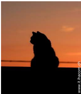
Gli animali domestici