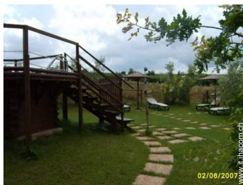
piscina fuori terra