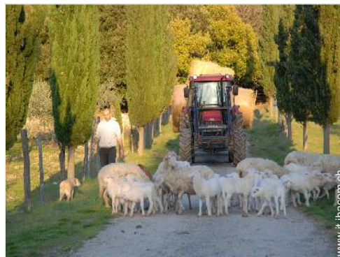
animali da fattoria

Bambini benvenuti Animali ammessi a condizioni (informarsi presso il proprietario) Presenza sul posto : animali domestici, equini, animali da fattoria, animali "selvaggi" Copertura telefonia mobile Acqua : calda/fredda Tensione elettrica : 220-240V / 50Hz Alimentazione elettrica : condotta