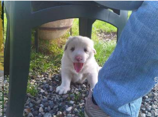
I vostri ospiti