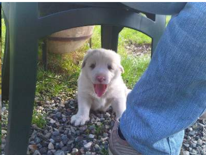
I vostri ospiti