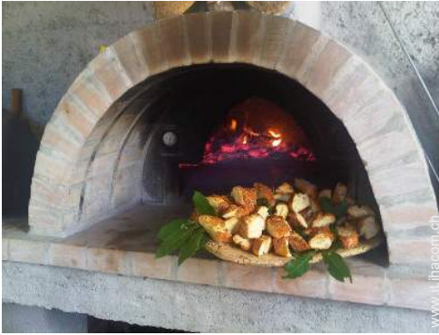
preparazione pasti tipici