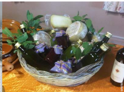
preparazione cesto da pic-nic