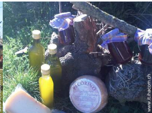
preparazione cesto da pic-nic