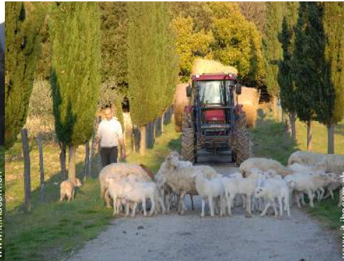
animali da fattoria