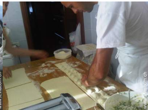
preparazione pasti tipici