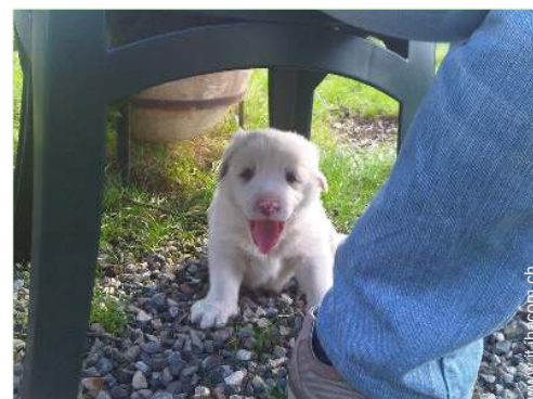
I vostri ospiti

Forno per pizze, barbecue, tavolo da giardino, 20 sedia(e) da giardino, pergolato, ombrellone, 15 sedia sdraio, 4 amaca(che), altalena, doccia esterna