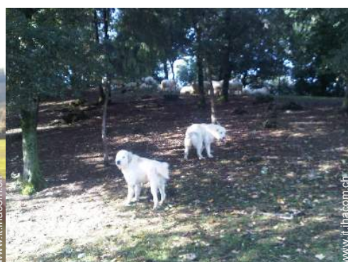
animali da fattoria