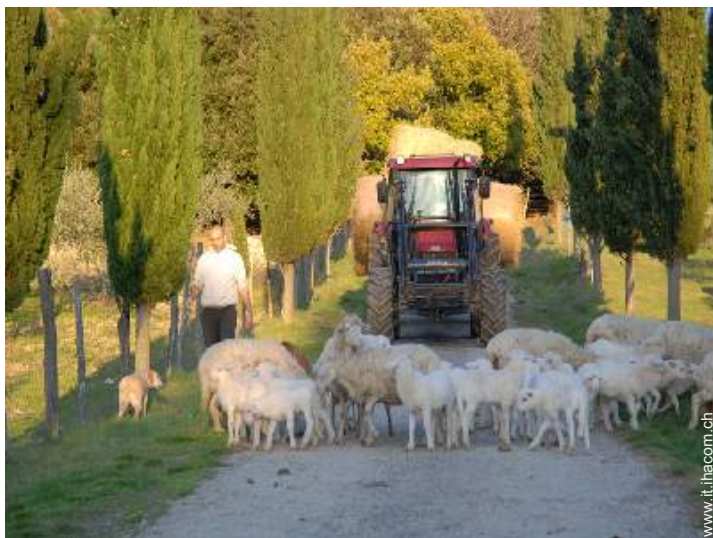
animali da fattoria