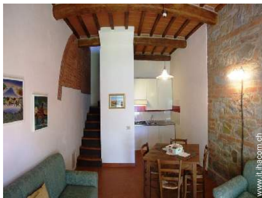
Sistemazione interna a disposizione degli ospiti