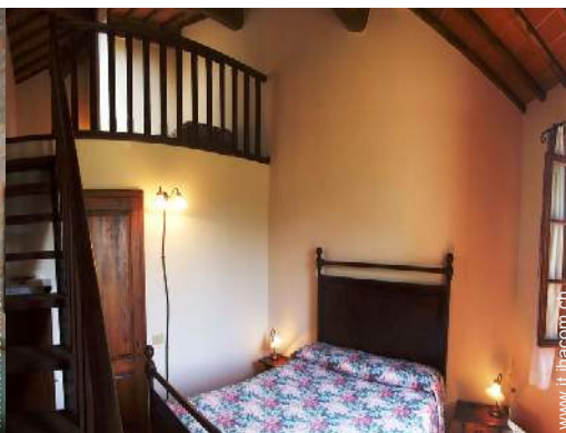
Sistemazione interna a disposizione degli ospiti