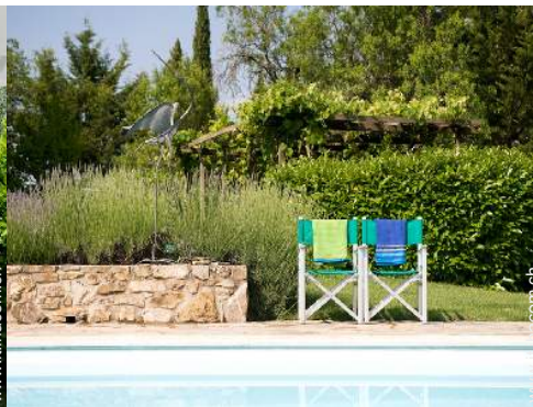
sedia(e) da giardino