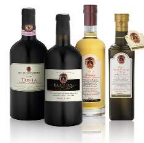
cantina e degustazione di vino