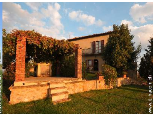
Ambito esterno a disposizione degli ospiti