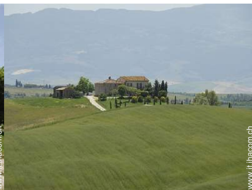
vista sui campi agricoli