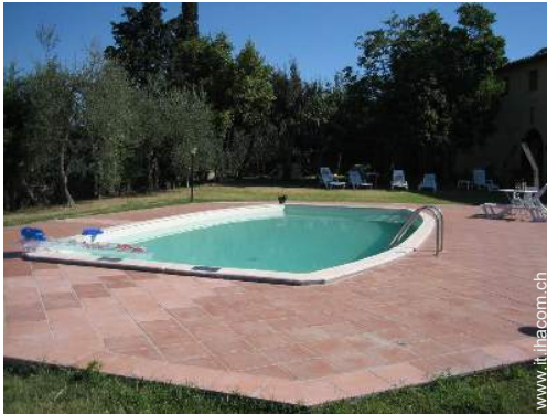
Piscina con acqua di mare