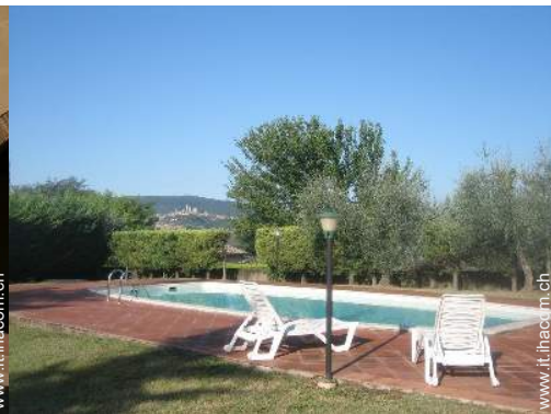
Piscina con acqua di mare