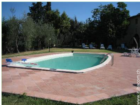
Piscina con acqua di mare