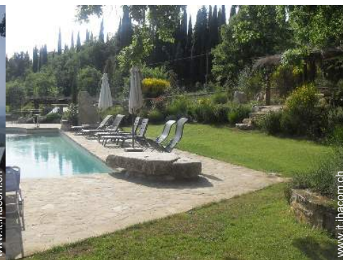
trampolino per tuffi