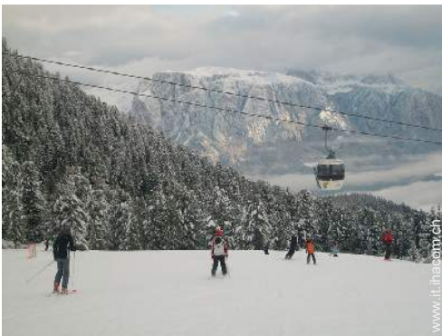
piste di sci