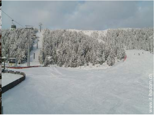
piste di sci