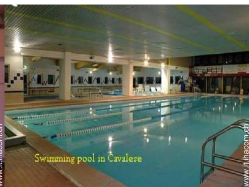
Swimming pool in Cavalese