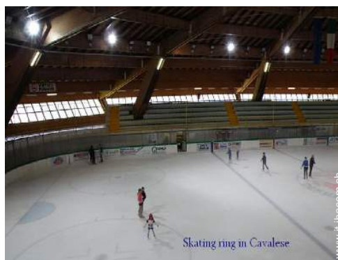
Skating ring in Cavalese