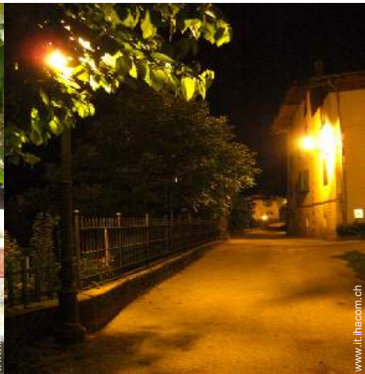
vista sul centro del paese