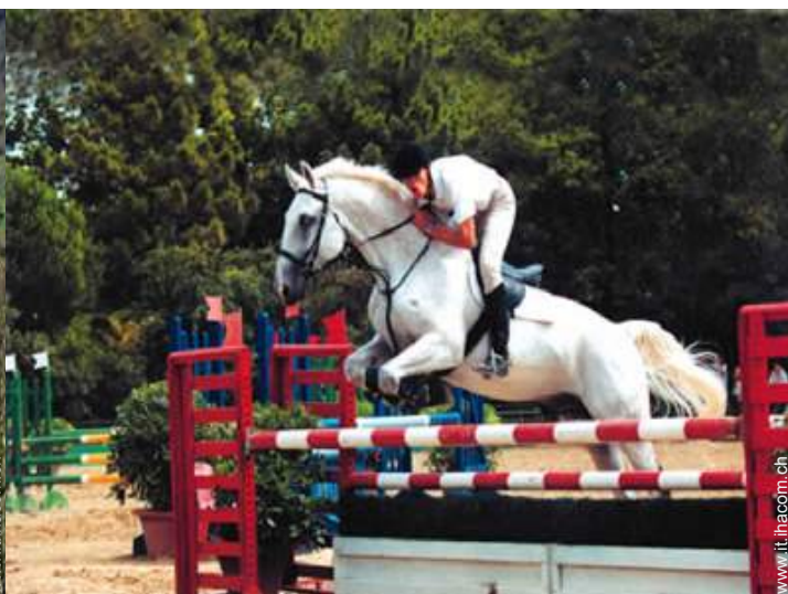
passeggiata a cavallo