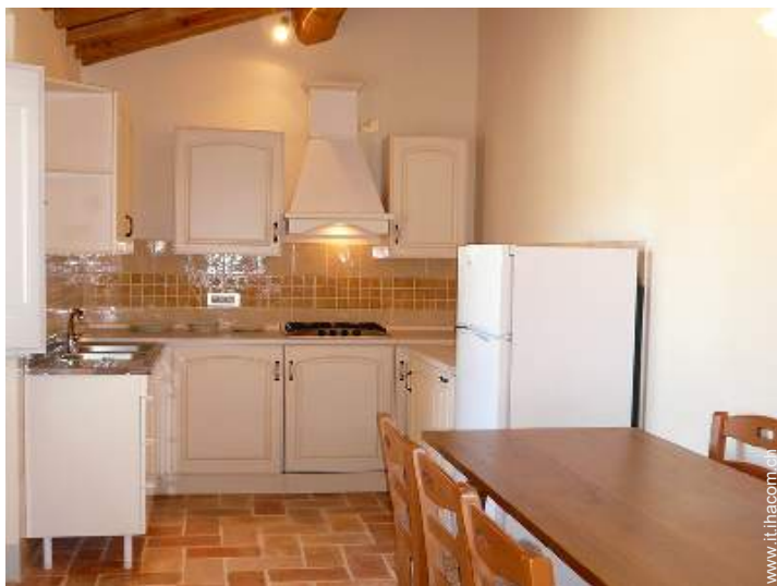
cucina a gas