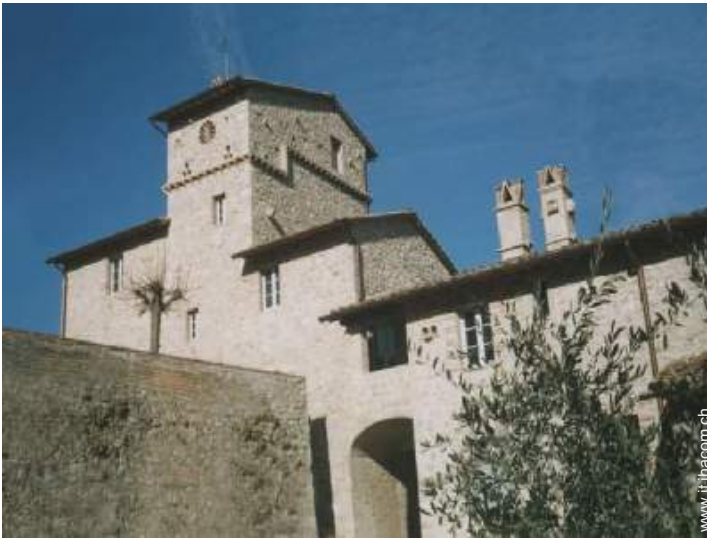
Casolare di Charme