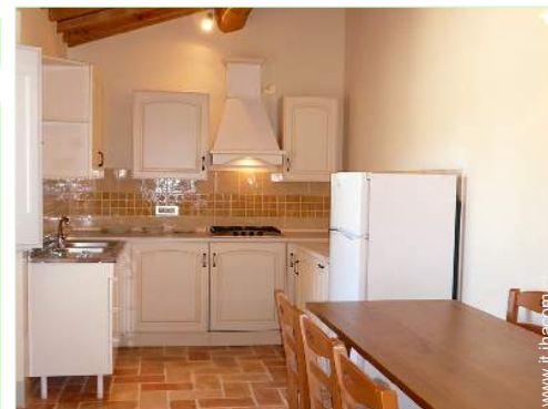
cucina a gas

Barbecue, tavolo da giardino, sedia(e) da giardino, ombrellone, sedia sdraio, dondolo, altalena, doccia esterna, WC esterno