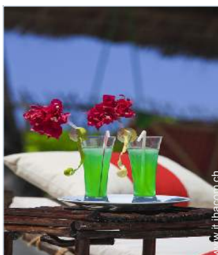
sedia(e) da giardino