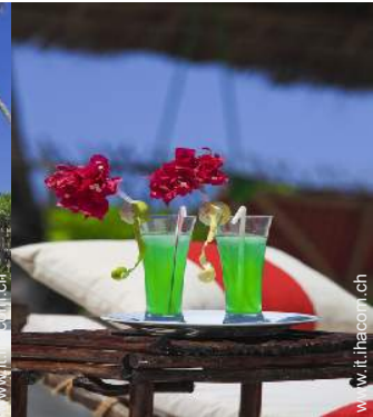
sedia(e) da giardino