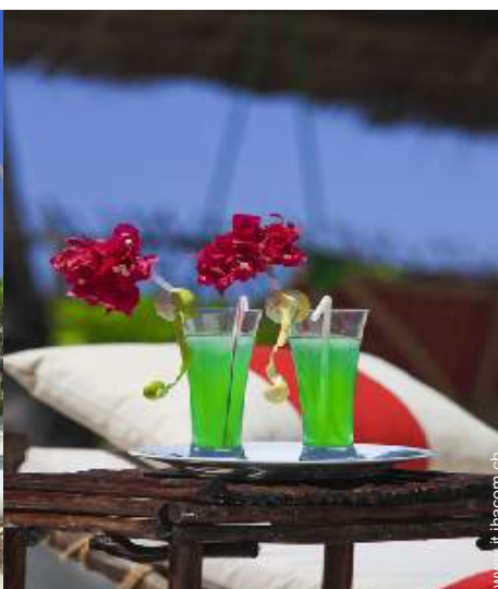
sedia(e) da giardino