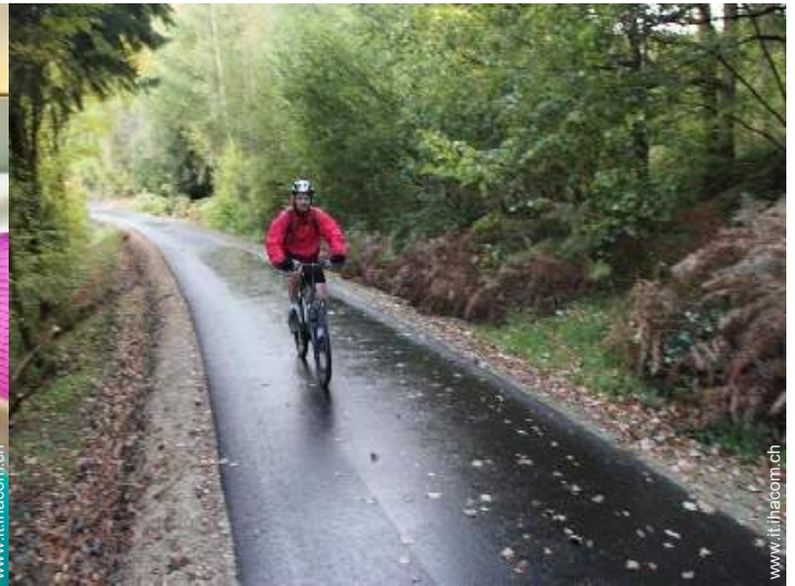
percorso per mountain bike