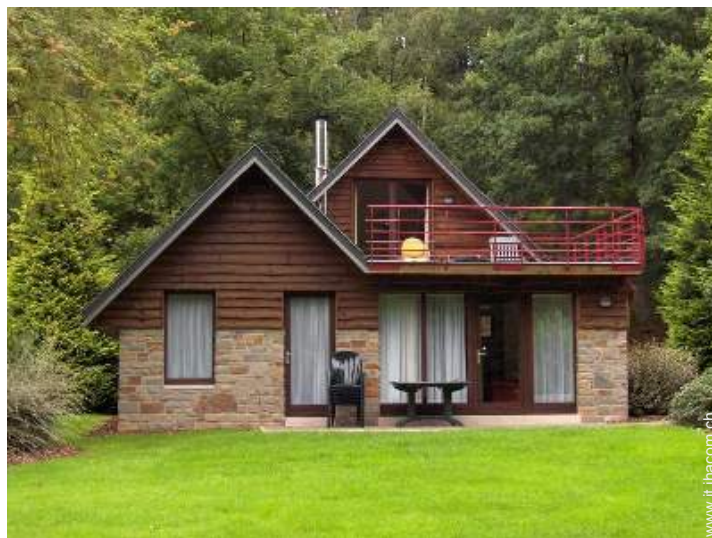
Casa in Pietra