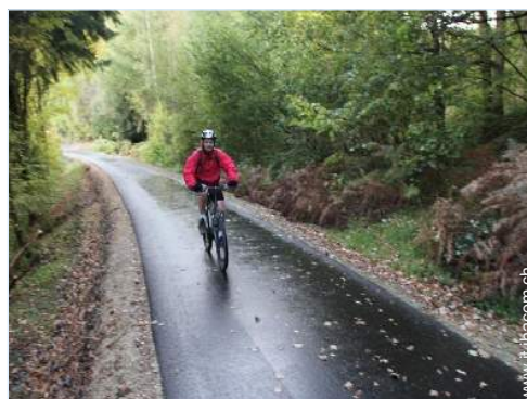
percorso per mountain bike