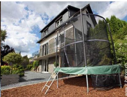
campo di bocce