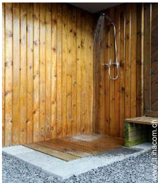
Attrezzature a disposizione