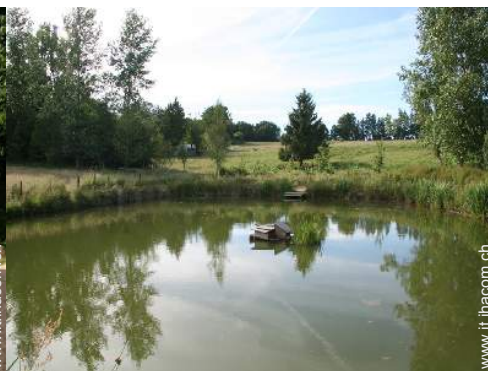
piscina fuori terra