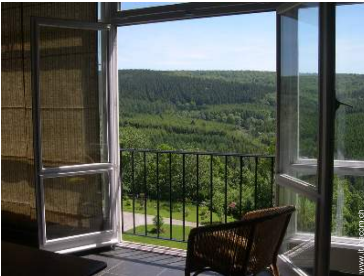
vista sulla foresta