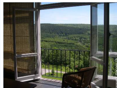
vista sulla foresta