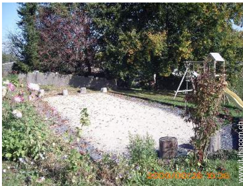
campo di bocce