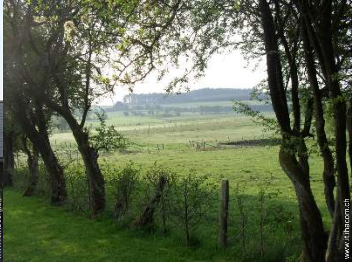
vista sul prato