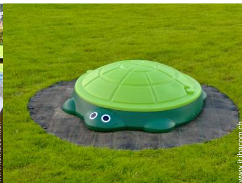
vasca per la sabbia