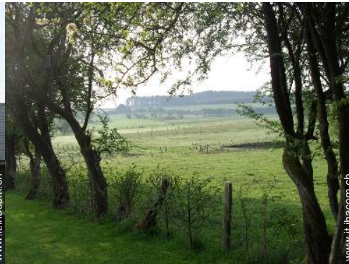
vista sul prato