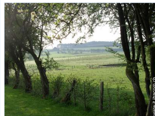
vista sul prato