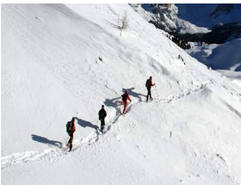
attività montane nelle vicinanze