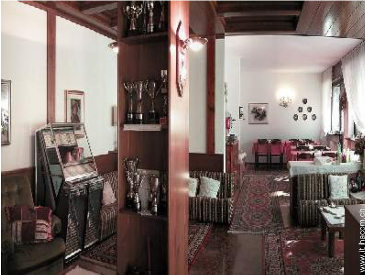
Presenza sul posto