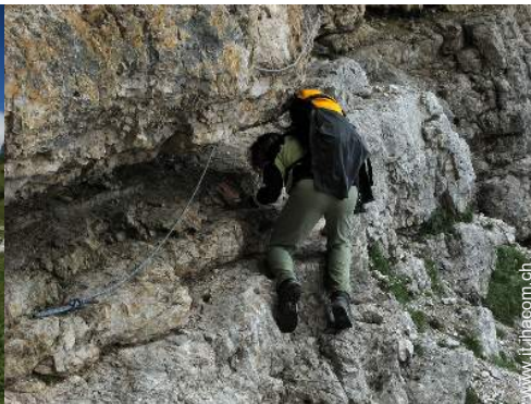
attività montane nelle vicinanze