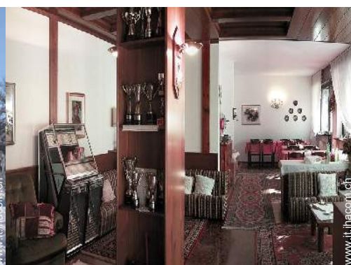
Presenza sul posto