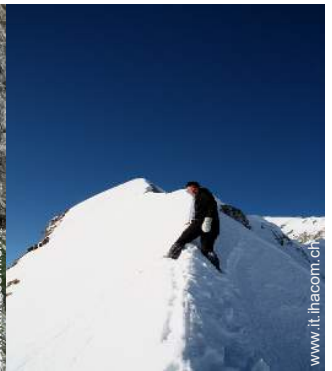
attività montane nelle vicinanze