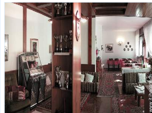
Presenza sul posto