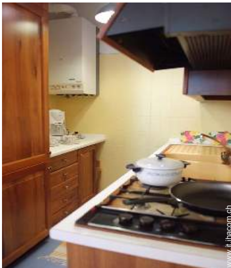
cucina a gas