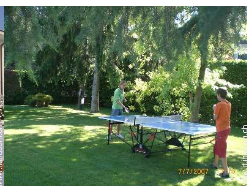
tavolo da ping-pong