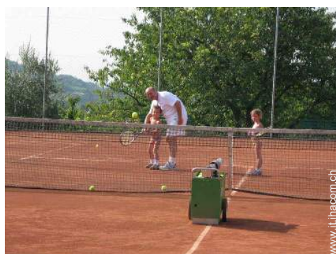
Tennis - terra battuta