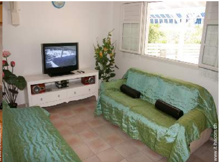
Disposizione interna e confort