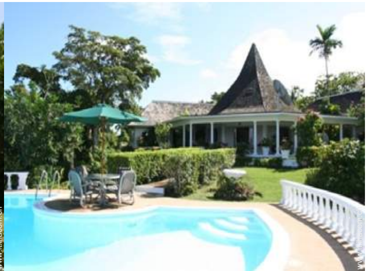
Villa di Charme