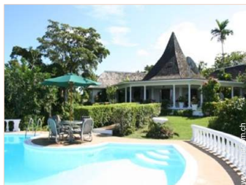
Villa di Charme