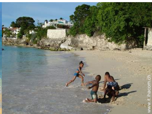
luogo per bagnarsi