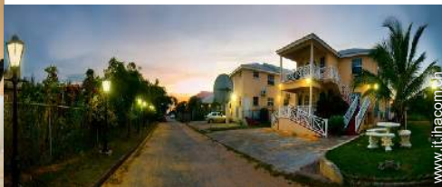
vista sulla strada/viale