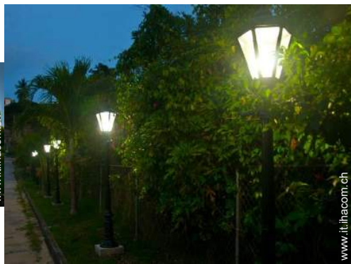
sistema di illuminazione