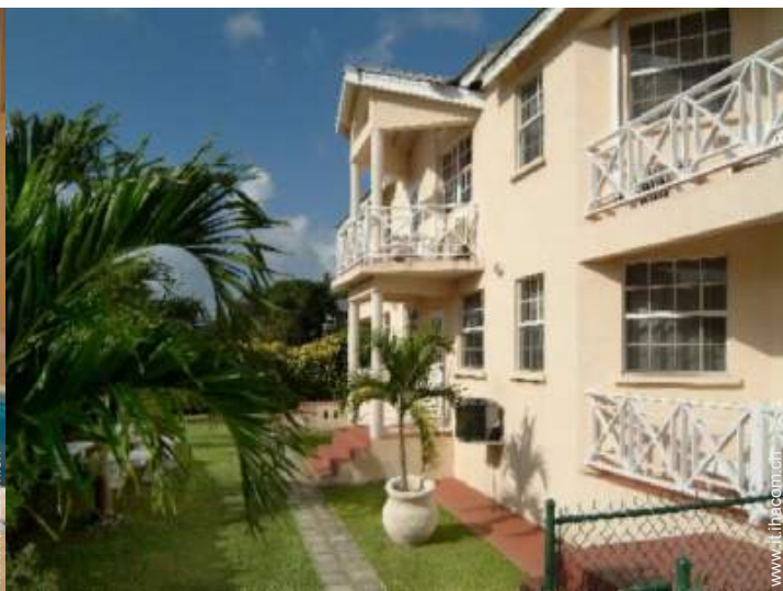
Proprietà di Charme