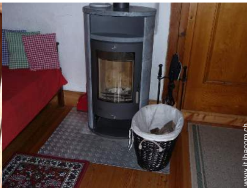
stufa a legna