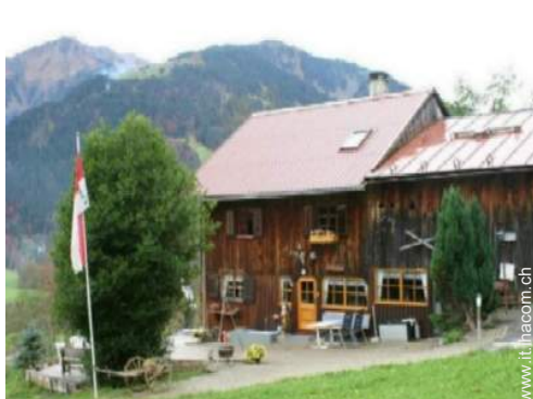
Chalet in Legno di Charme