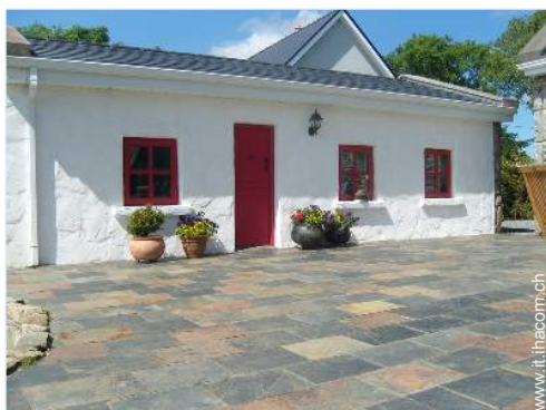
Proprietà di Charne