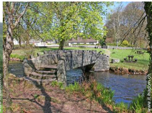
parco e giardino