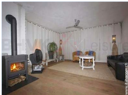
stufa a legna

Privilegi : Accesso diretto alla spiaggia, posto barca al porto, campo pratica, green