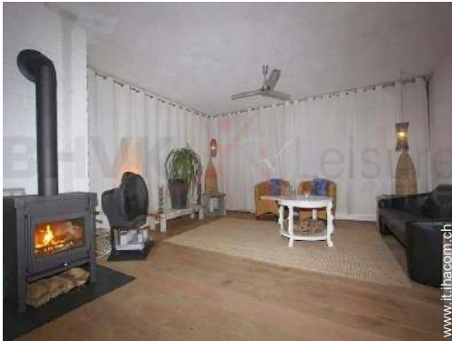
stufa a legna