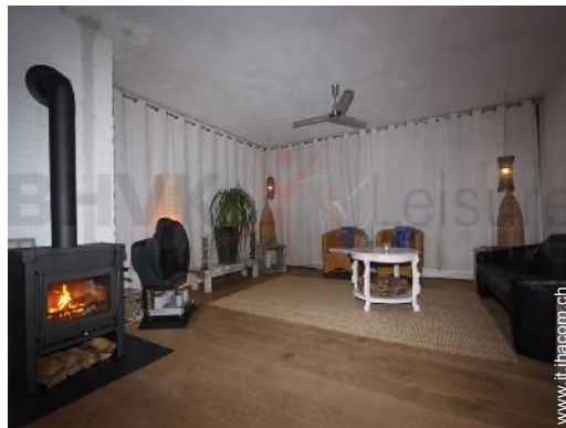
stufa a legna