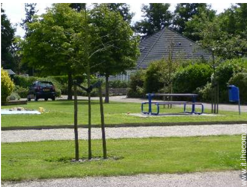
campo di bocce