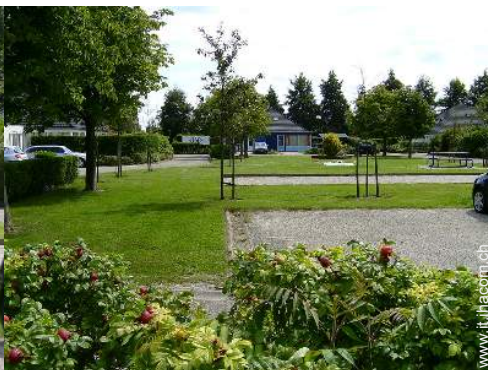
campo di bocce