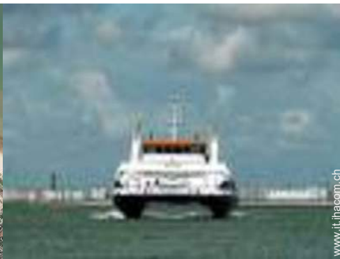
punto di windsurf