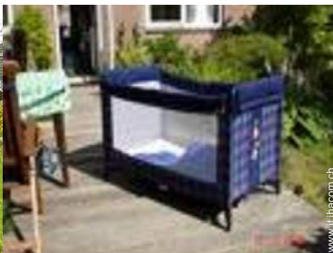
letto (i) bambino